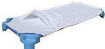
Mides del llençolet 132 x 53 cm.

El llençolet de sota el rebreu cada divendres per a rentar, i al següent dilluns haureu de portar-lo net. Cada nen i nena ha de dur també, dos pitets i un llençol o manteta petits per tapar-se si cal, que es retornaran per rentar els divendres, juntament amb el llençol de sota. Tot marcat amb noms i cognoms dins d'una bosseta.