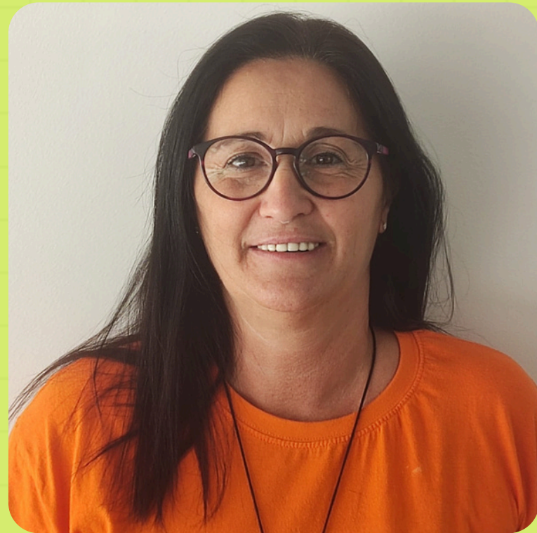
COORDINACIÓ: PEPI GALVÁN